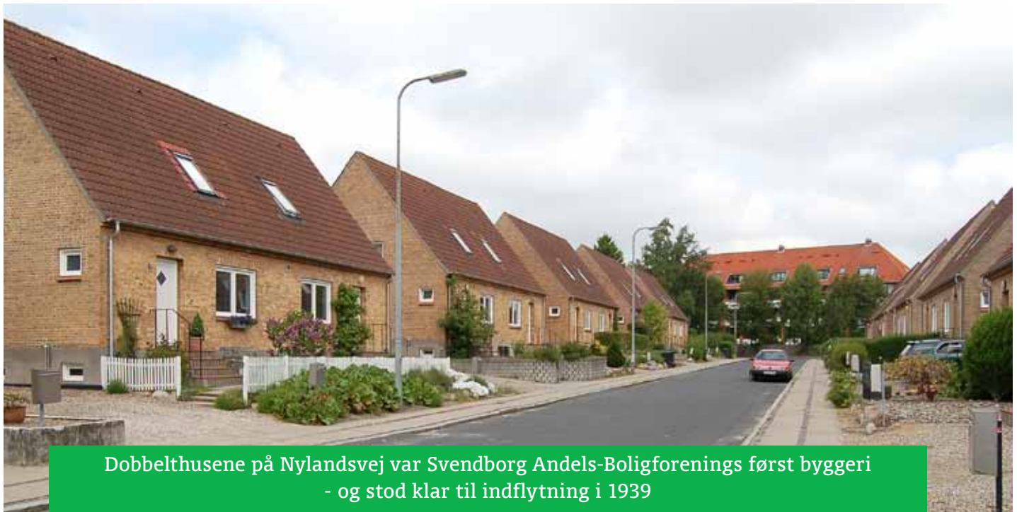
Doppelthuse på Nylandsvej var Svendborg Andels-Boligforenings først byggeri - og stod klar til indflytning i 1939

14. Forandringer af lejligheden må kun ske med bestyrelsens samtykke.