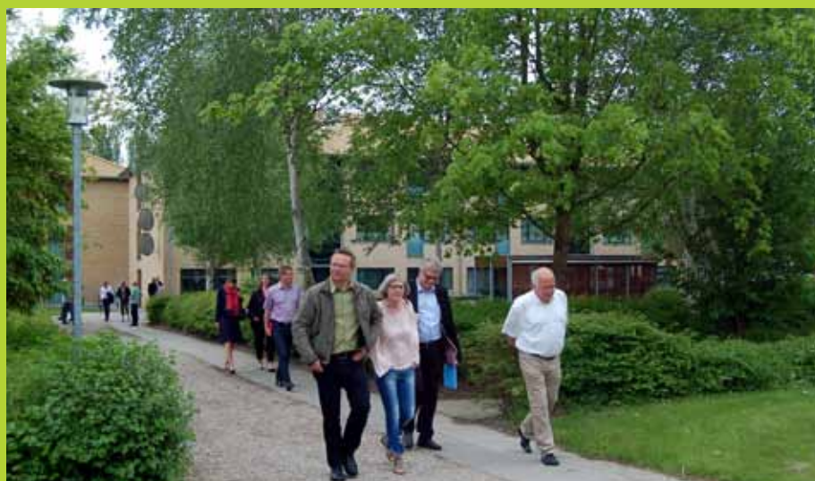
Landsbyggefondens bestyrelse på tur i området omkring Skovbyhus